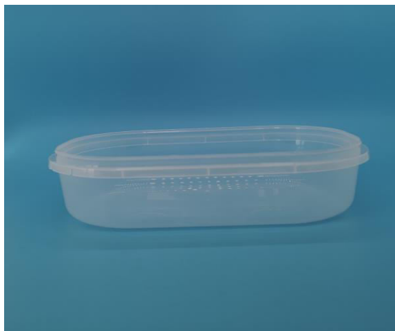
immagine indicativa del prodotto