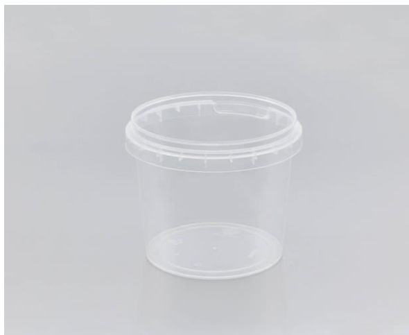
immagine indicativa del prodotto