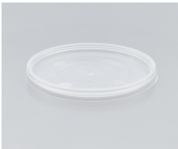
immagine indicativa del prodotto