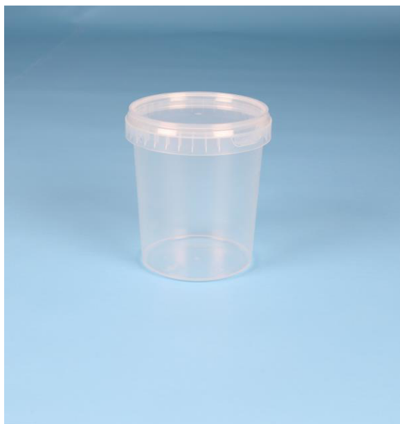
immagine indicativa del prodotto