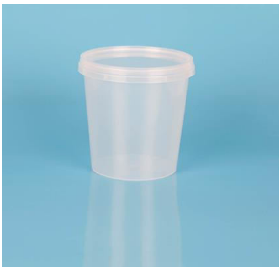
immagine indicativa del prodotto