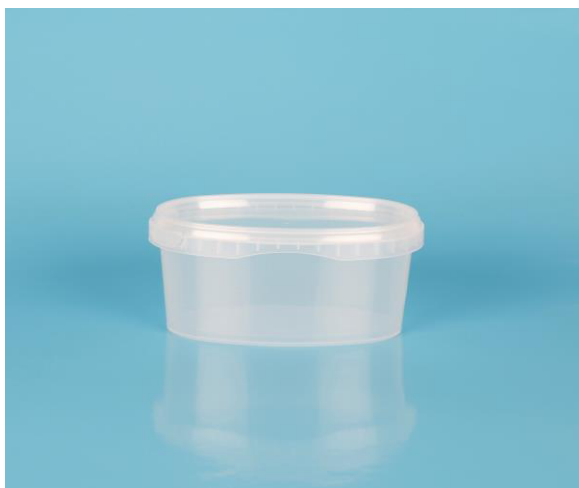
immagine indicativa del prodotto