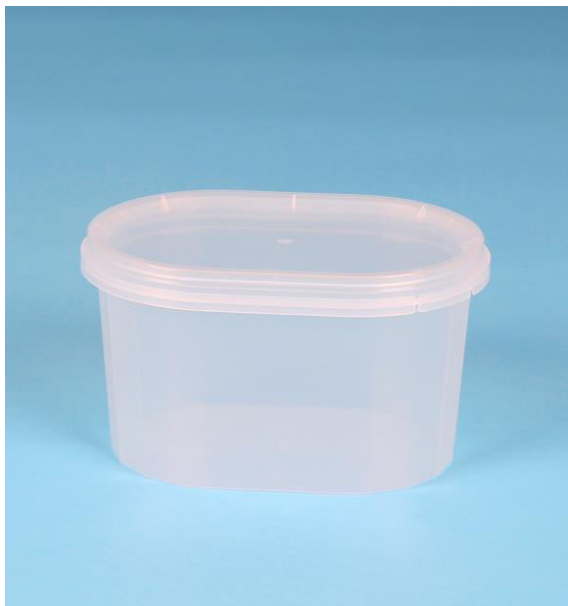
immagine indicativa del prodotto