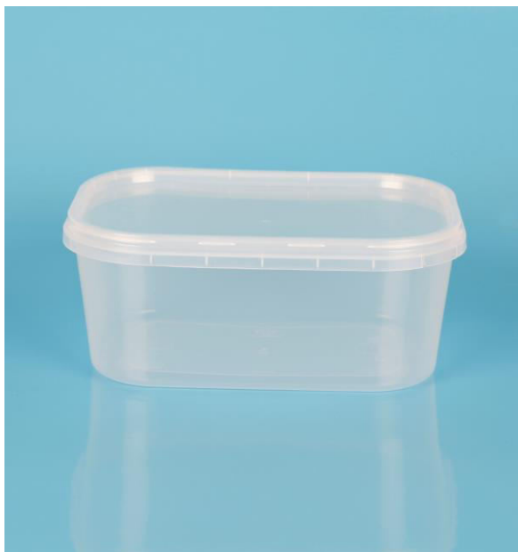
immagine indicativa del prodotto