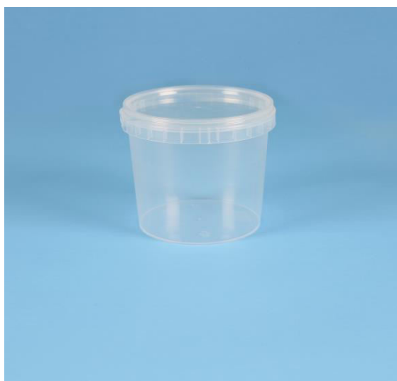
immagine indicativa del prodotto