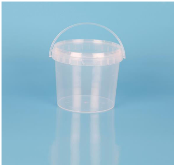
immagine indicativa del prodotto