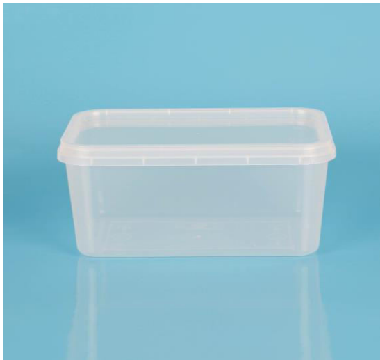
immagine indicativa del prodotto