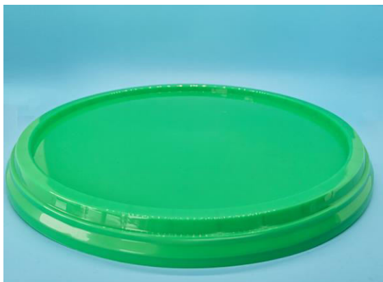
immagine indicativa del prodotto