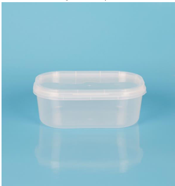
immagine indicativa del prodotto