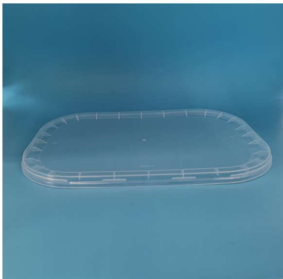
immagine indicativa del prodotto