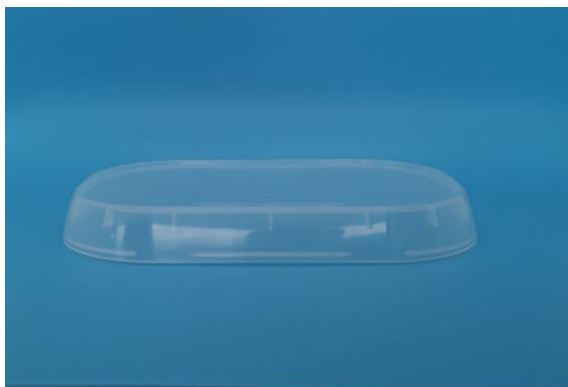
immagine indicativa del prodotto