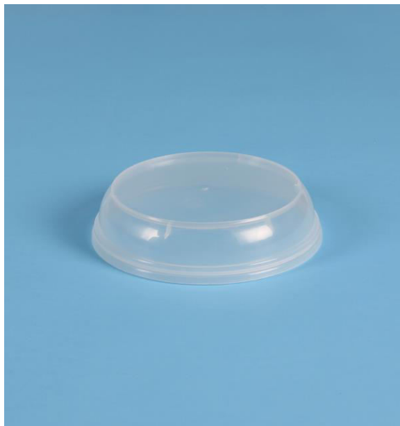
immagine indicativa del prodotto