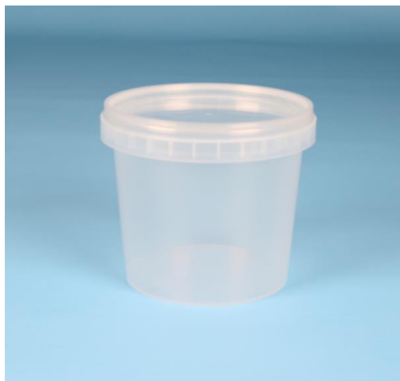
immagine indicativa del prodotto