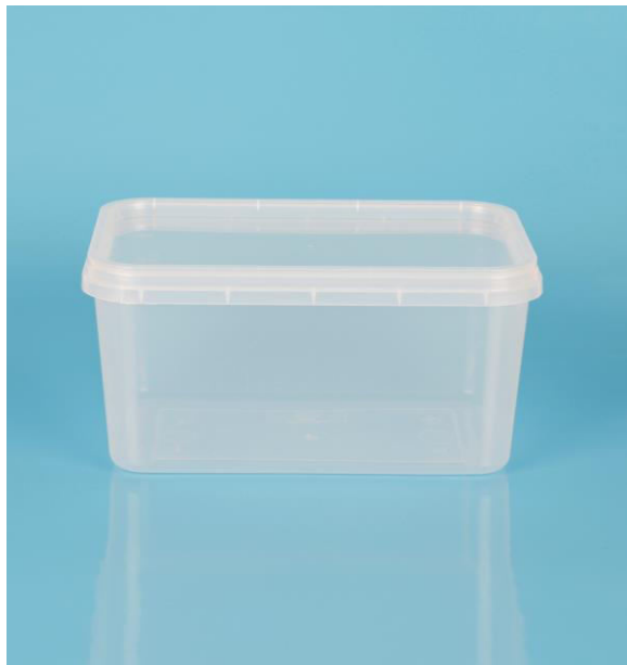
immagine indicativa del prodotto