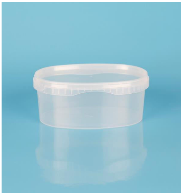
immagine indicativa del prodotto