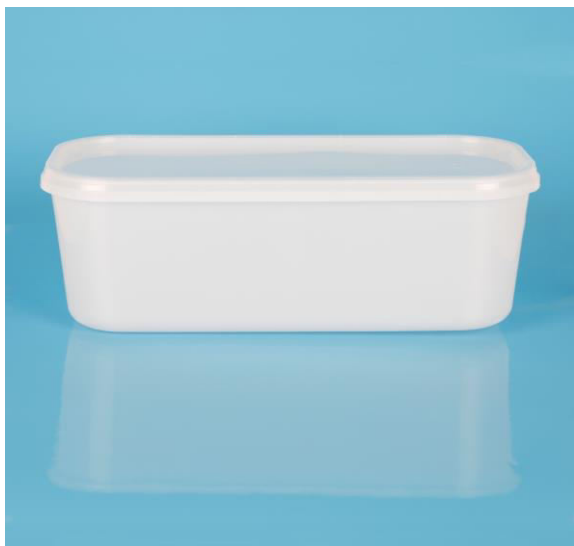
immagine indicativa del prodotto